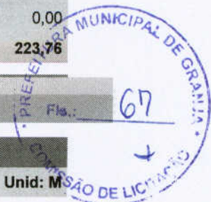
Tabela de Custos - Versão 024.1