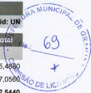
Tabela de Custos - Versão 024.1