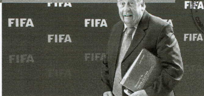
MICHEL D'Hooghe é médico-chefe da entidade máxima do futebol