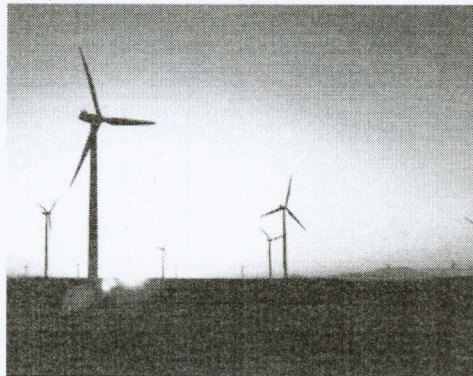
CEARÁ é referência na produção de energia a partir dos ventos