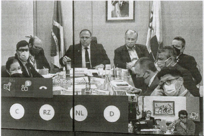
CAMILO se reuniu com o ministro e os demais governadores antes de anunciar decreto com novas medidas

O cronograma apresentado por Pazuello apontava que o Brasil receberia cerca de 45,9 milhões de doses de vacinas em 2021. Além disso, há negociações com a Pfizer e Janssen sob “óbice jurídico”, segundo os dados apresentados.