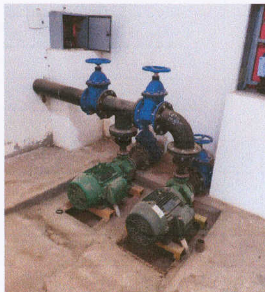
Figura 7 – Bombeamento para Adrianópolis

➤ Bombeamento: No que tange ao bombeamento na elevatória, a manutenção da bomba reserva que recalca para Adrianópolis deve ser feita, pois não está funcionando, como também a bomba reserva que recalca para Timonha, porque apresenta vazamento quando testada. Um novo quadro elétrico torna-se importante, pois o atual está danificado.