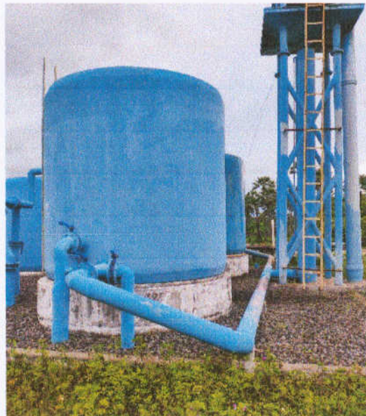
Figura 5 – Filtros e aerador da ETA

➤ Pintura: A casa de operação, a cerca, os reservatórios apoiados, equipamentos da ETA ( filtros e aerador ) sofreram desgaste da pintura a partir dos ciclos das condições climáticas de exposição sol, chuvas fortes e umidade, portanto devem ser reparadas.