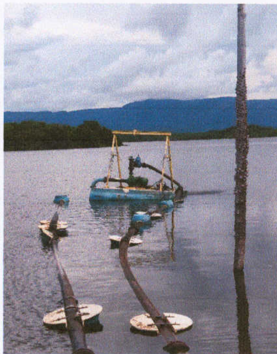
Figura 1 – Flutuante sobre o açude Itaúna

➤ Conexões da margem: Acrescentando-se a mudança das conexões do barrilete da bomba, o registro de cabeçote DN=200mm da margem demonstra desgaste e vazamentos precisando ser substituído. Para auxiliar o funcionamento da adutora que segue a partir da captação será adotado uma válvula de retenção DN=300mm.