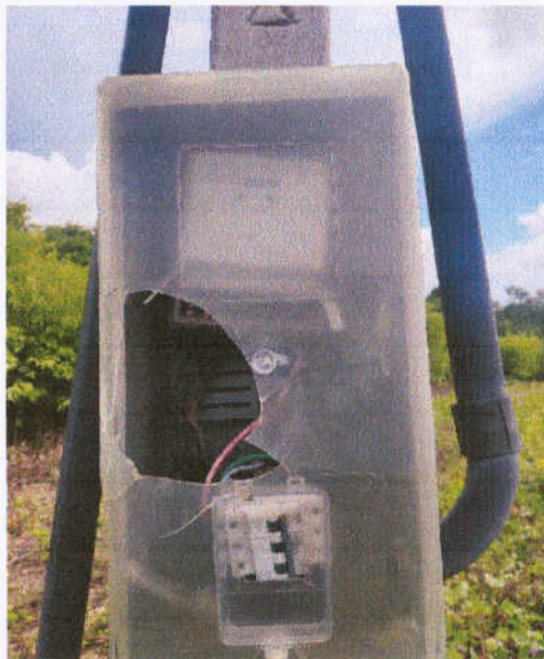
Figura 14 – Quadro de medição nos reservatórios de Timonha