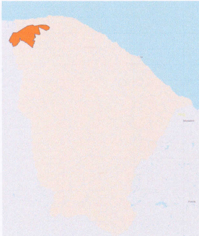
Figura 1 – Mapa Territorial do município de Granja