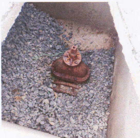
Figura 2 – Registro de cabeçote na margem do açude