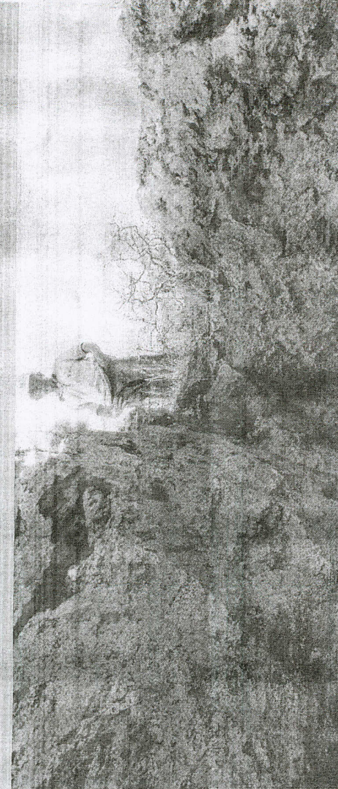
FUNCIONÁRIO mostra local da mina de Itaitaia