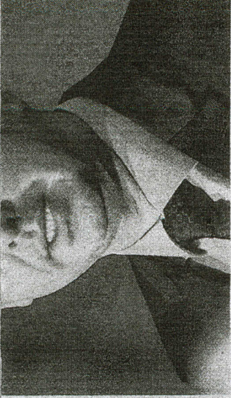
PACHECO fez coro e criticou autoritarismo