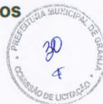
Tabela de Preços para Materiais Betuminosos 2021/08

GOVERNO DO ESTADO DO CEARÁ Secretaria da Infraestrutura