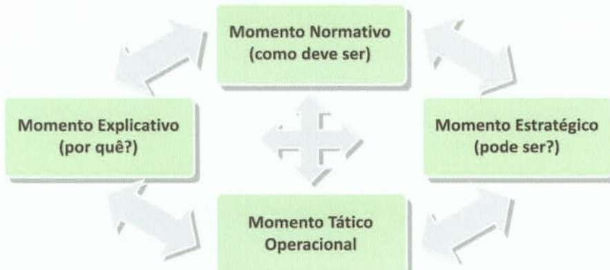
Figura 2: Modelo Explicativo do PES.